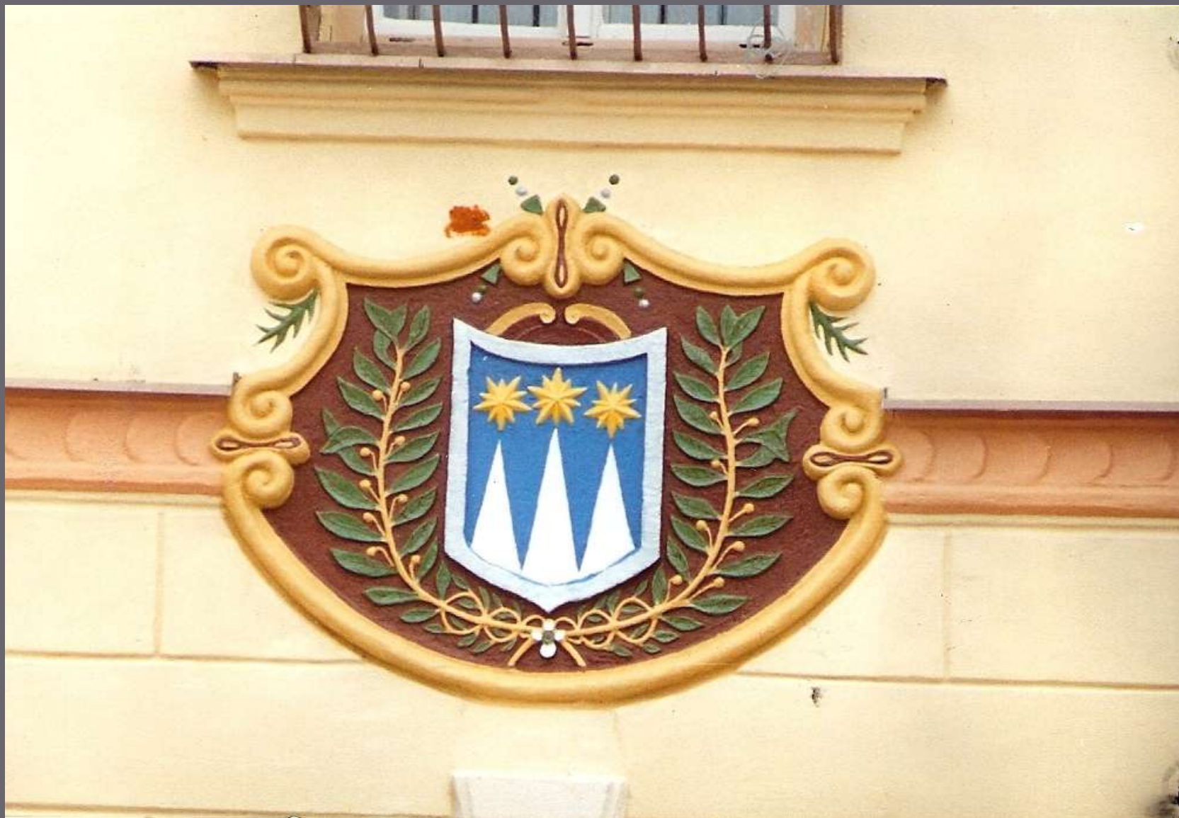
Znak Jíramova v průčelí radnice