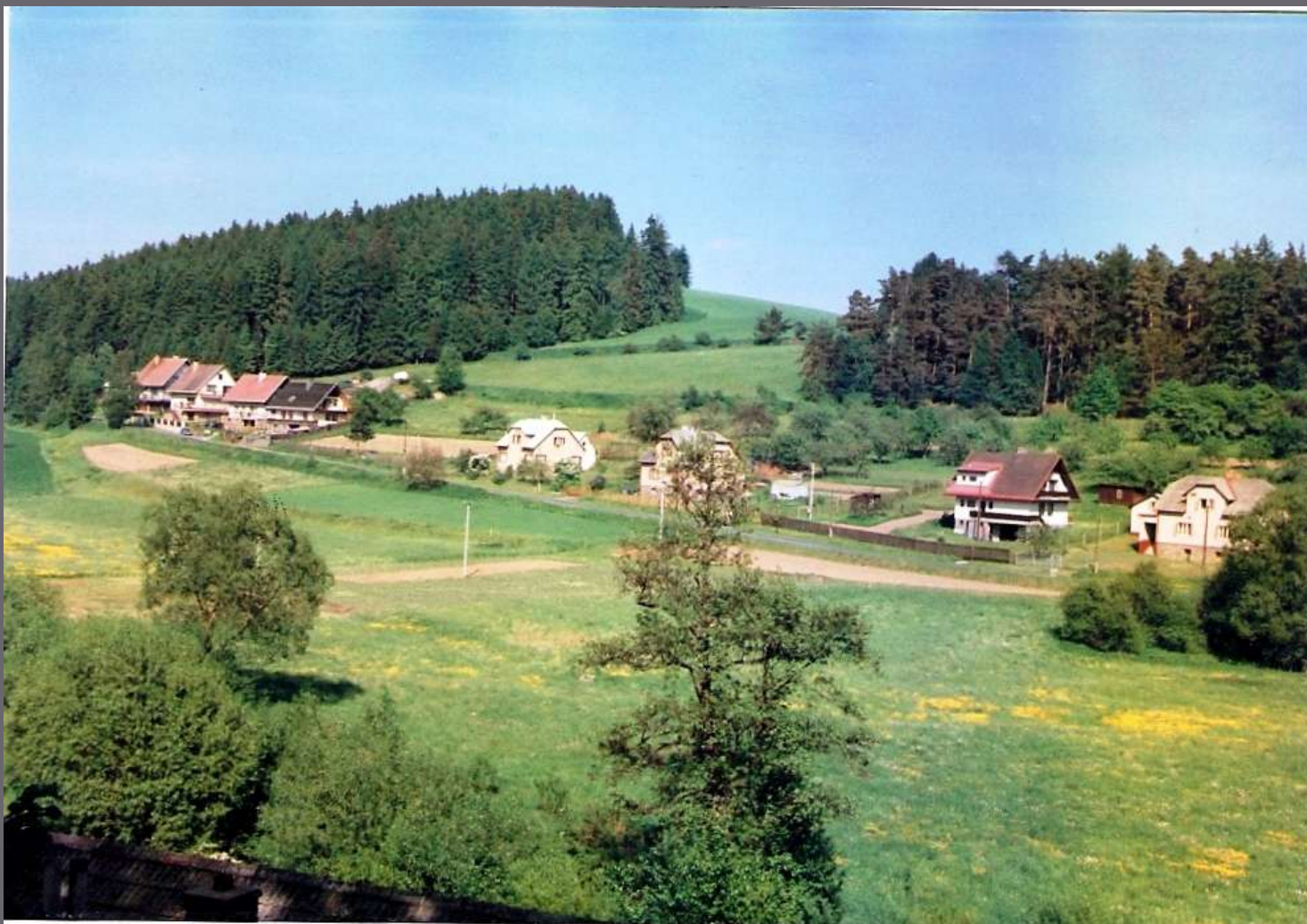
NOVÁ VÝSTAVBA NA SEDLIŠŤSKÉ