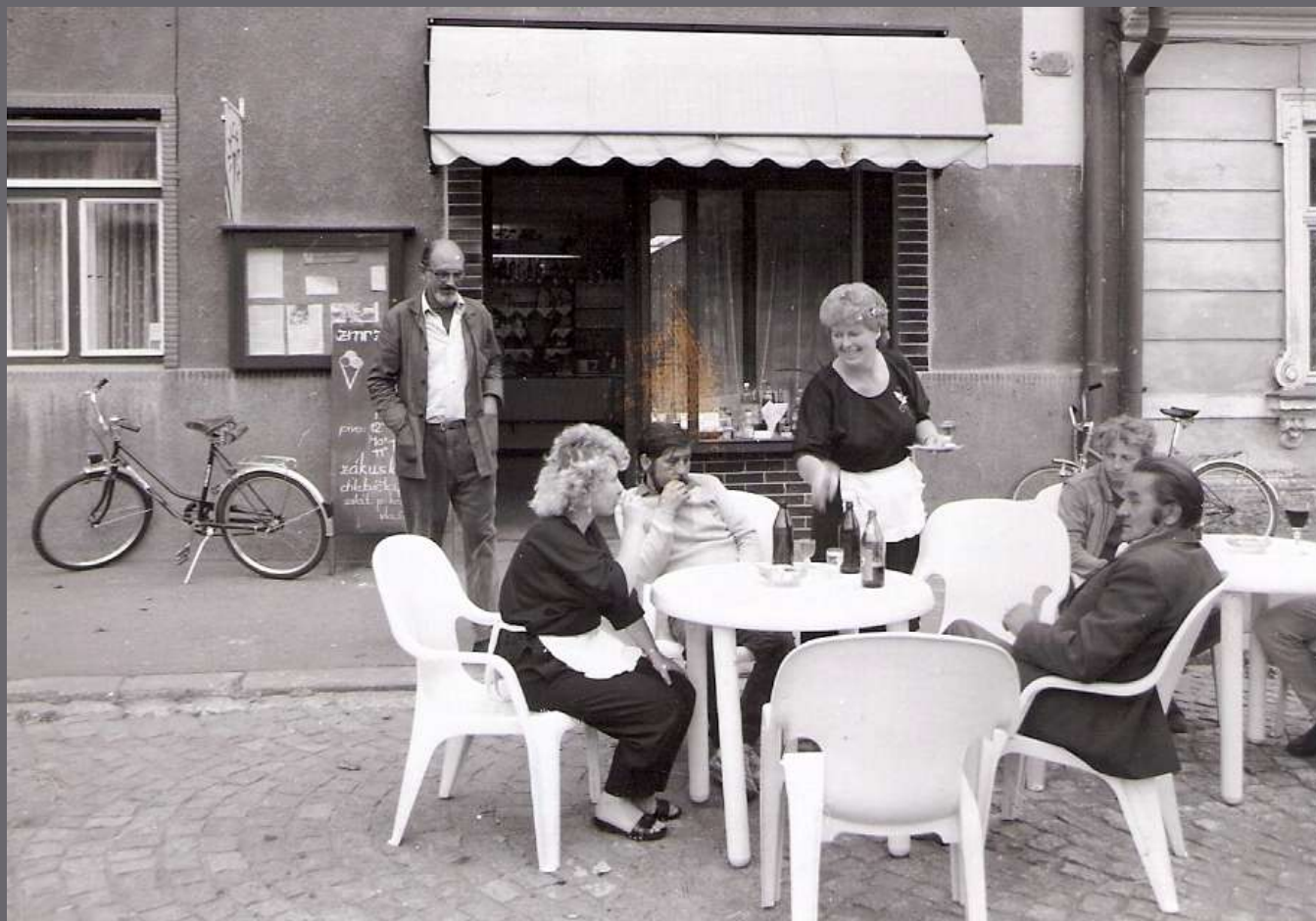
NOVÁ PROVOZOVNA OBČERSTVENÍ – BISTRO NA NÁMĚSTÍ