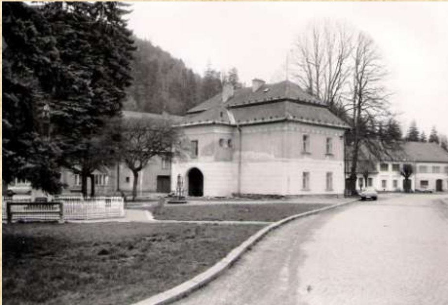
Parčík za Horní školou po odstranění Mostní váhy a živého plotu