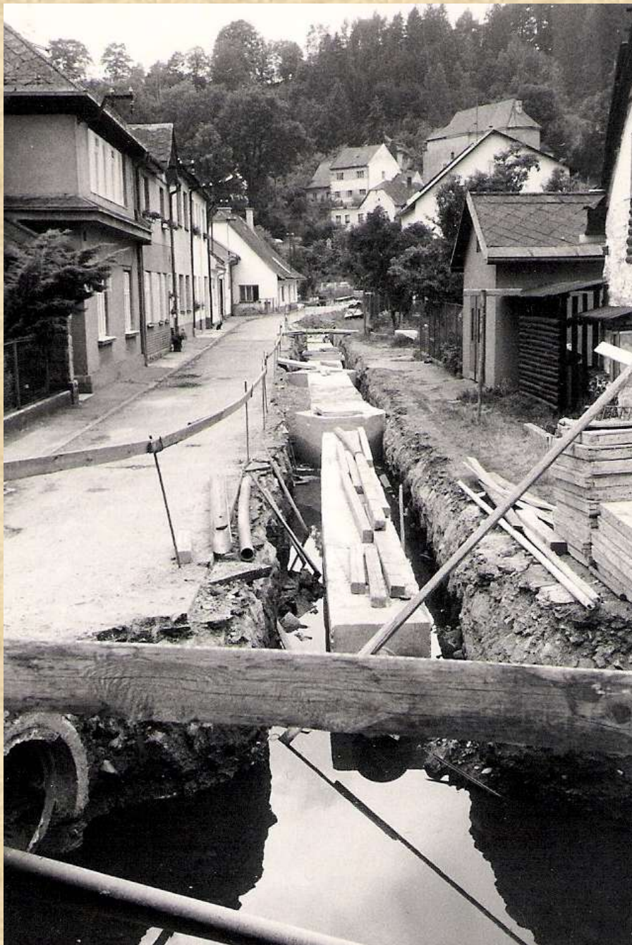
Výstavba nové kanalizace v Dolní ulici