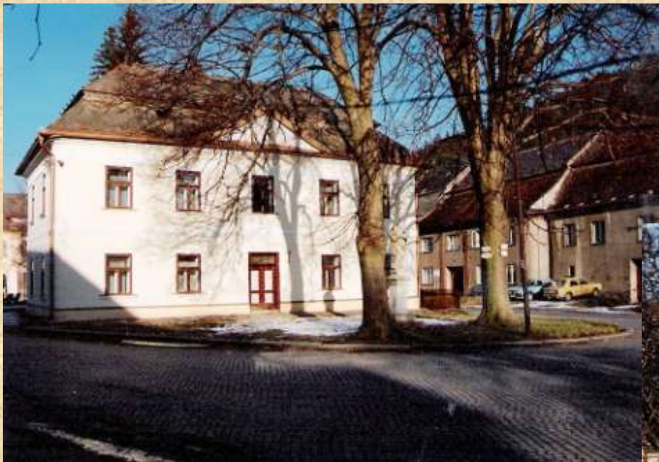
Budova Horní školy po opravě fasády