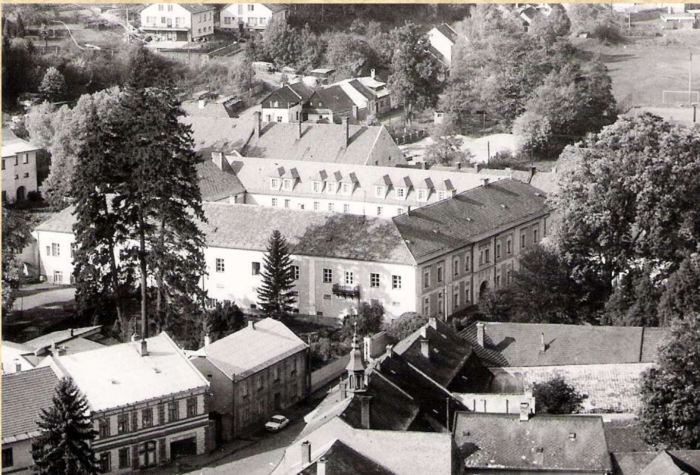
Sídlo Železničního odborného učiliště - zámek - získali zpět bývalí majitelé rodina Belcrediů